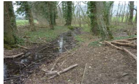
Situation avant travaux (vue sur un bras mort de l'Asse).

Au lieu-dit Le Fief, sur la commune de Chésereux, un étang était autrefois présent au bord de l'Asse, en zone forestière. Cet étang s'est intégralement comblé et seuls quelques écoulements d'eau de surface ainsi que des petites « gouilles » y était encore visibles, témoignant d'un sol naturellement étanche.