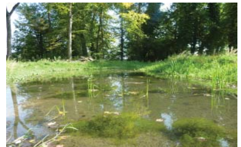
Situation une année après travaux. La végétation des milieux humides a vite retrouvé un milieu adapté.